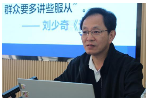
赵经理事长在讲党课