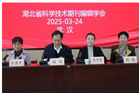
在主席台就坐的领导